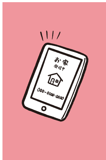
お家の人に電話 してください券