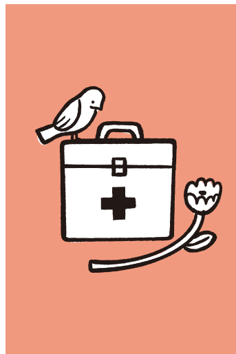
保健室に行きたい券