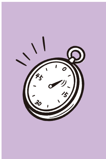
もう1時間 チャレンジ券