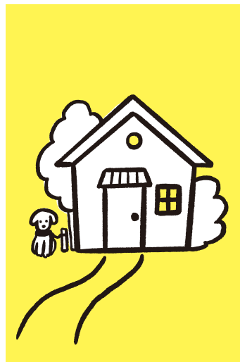
お家に帰りたい券